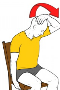
Estiramiento elevador de la escapula