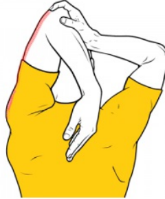
Estiramiento de tríceps detrás de la cabeza