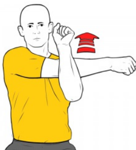
Estiramiento hombro posterior