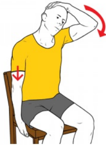
Estiramiento para trapecio medio sentado