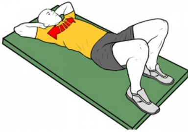
Estiramiento bilateral de hombros