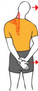
Estiramiento de trapecio y cuello con brazo en la espalda